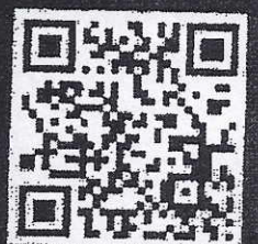
ลงทะเบียน สพจ.สงขลา