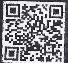
ลงทะเบียน สว.สวนปรุง

ขอสงวนสิทธิ์ลงทะเบียน 1 ท่าน / 1 แห่งฝึกอบรม