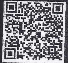
รายละเอียดหลักสูตร